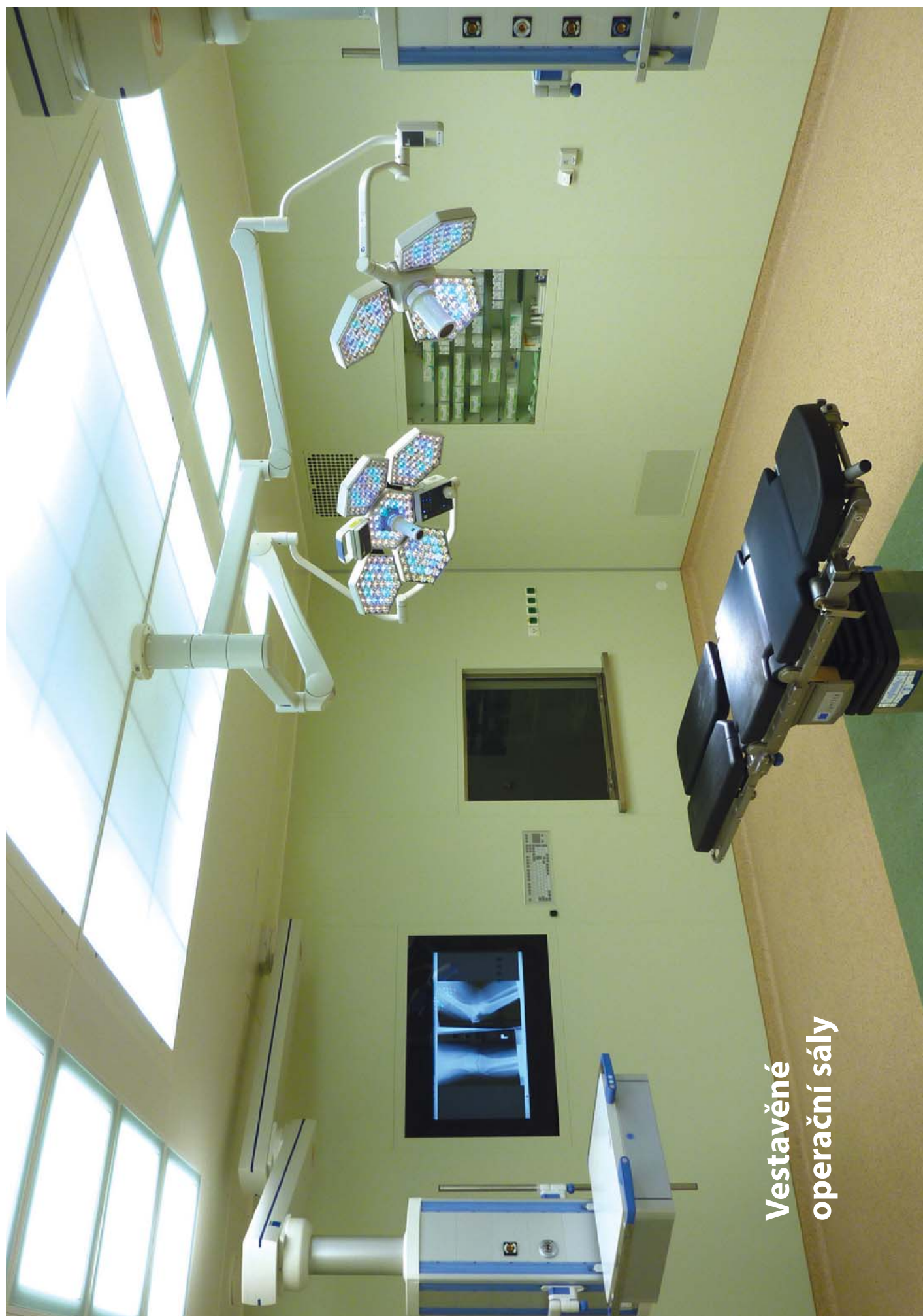
Vestavěné operační sály