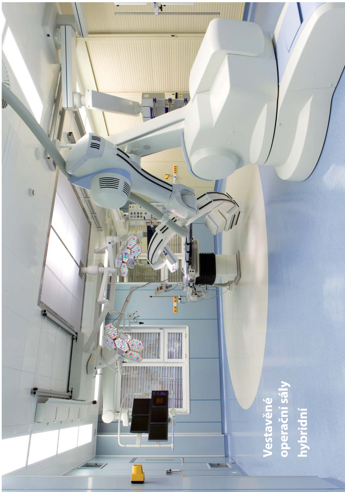
Vestavěné operační sály hybridní