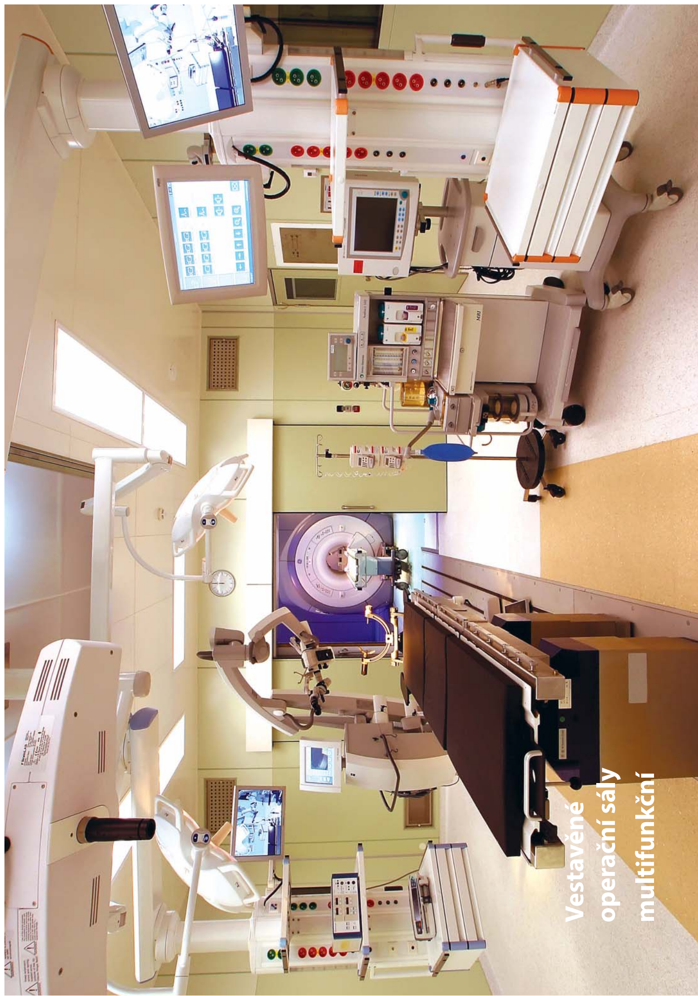
Vestavěné operační sály multifunkční